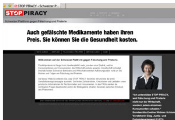
La dichiarazione del 2009 della consigliera federale Eveline Widmer-Schlumpf sul sito di STOP ALLA PIRATERIA

Il sito di STOP ALLA PIRATERIA si propone di dimostrare che il fenomeno della contraffazione e della pirateria non tocca soltanto gli interessi dei singoli, ma ha conseguenze per tutti. Rilasciando brevi dichiarazioni, alcune personalità della politica e dell'economia si schierano pubblicamente con l'associazione STOP ALLA PIRATERIA. La cooperazione tra settore pubblico, economia e rappresentanti dei consumatori fa sì che la lotta alla contraffazione e alla pirateria sia percepita come uno sforzo congiunto a tutela di interessi comuni.