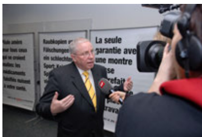
Conferenza stampa per lanciare la 1ª campagna di STOP ALLA PIRATERIA con il consigliere federale Christoph Blocher.

Il 16 gennaio 2007 la Piattaforma e la prima campagna di sensibilizzazione sono presentate ai media all'aeroporto di Zurigo sotto l'egida dell'IPI e dell'ICC Svizzera. La campagna, che consiste in una serie di manifesti dedicati ai diversi settori colpiti, è inaugurata dal consigliere federale Christoph Blocher, il quale coglie l'occasione per sottolineare l'importanza di proteggere la proprietà intellettuale e mettere in guardia dai rischi per la sicurezza e la salute legati alle contraffazioni. I manifesti, che attirano l'attenzione del pubblico con slogan ad effetto, restano affissi per un mese nelle principali città svizzere e nei loro sobborghi.