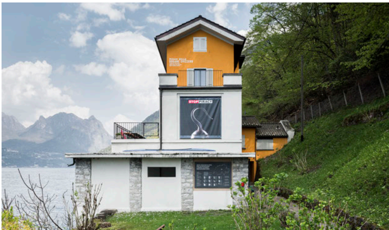
Mostra «Non è tutto oro quel che luccica» presso il Museo delle dogane svizzero, 2016-2018