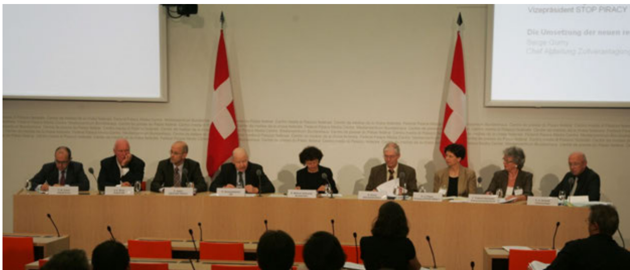
Conferenza stampa a Palazzo federale in occasione dell'entrata in vigore delle nuove disposizioni legali il 1° luglio 2008

Le disposizioni di lotta alla contraffazione e alla pirateria entrate in vigore il 1° luglio 2008 vietano l'importazione in Svizzera, anche per uso personale, di prodotti di marca o di design contraffatti. Un adeguamento della legge era ormai imprescindibile: acquistando merce contraffatta all'estero o in rete, i consumatori svizzeri sostenevano il crimine organizzato, nella maggior parte dei casi senza esserne consapevoli. Dal 2008 chi cerca di introdurre in Svizzera prodotti contraffatti rischia brutte sorprese. Le dogane possono infatti sequestrare e distruggere la merce in frontiera, anche se questa non è destinata alla vendita e indipendentemente dalle quantità.