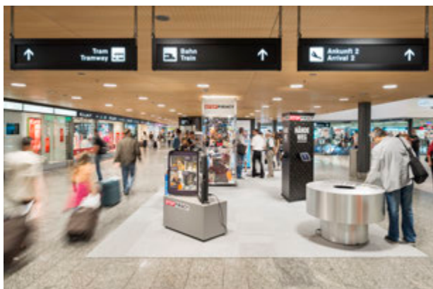
Lo stand di STOP ALLA PIRATERIA presso l'aeroporto di Zurigo-Kloten nel 2013

Dal luglio 2008 la dogana svizzera può sequestrare anche gli articoli contraffatti importati nell'ambito del traffico turistico come borsette, abiti, medicinali e orologi. Per attirare l'attenzione dei turisti sui rischi e sui pericoli dei prodotti contraffatti, l'inizio della stagione estiva è segnato regolarmente da una campagna informativa organizzata dall'associazione STOP ALLA PIRATERIA negli aeroporti di Zurigo-Kloten o Ginevra-Cointrin. Questa campagna, condotta nove volte dal 2009, si accompagna a una campagna mediatica che consente di raggiungere indirettamente un pubblico più ampio.